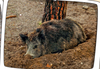
Hueco en el suelo: encame o revolcadero