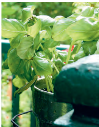
Todas las hierbas aromáticas, como la albahaca, se pueden cultivar en maceta.