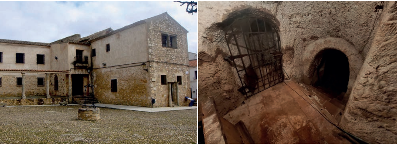
Edificio en el que estuvieron los antiguos juzgados (izq.) y galerías subterráneas del Palacio Buenavista de Belmonte —actual hospedería—, lúgubres calabozos durante su etapa como cuartel de la Guardia Civil.

Media hora escasa estuvieron deliberando los doce jueces de hecho. La casi coincidencia de peticiones entre fiscal y defensores no permitió ninguna discusión. El veredicto fue de culpabilidad. Las preguntas formuladas al jurado fueron las siguientes: