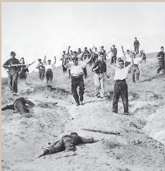
Combatientes durante la guerra civil (1936-1939)