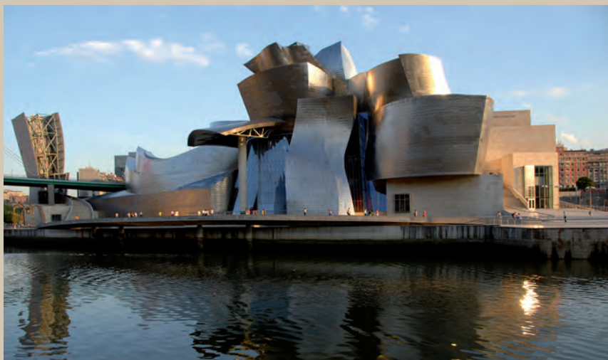
El Museo Guggenheim de Bilbao , obra del arquitecto canadiense Frank O. Gehry, inaugurado en 1997