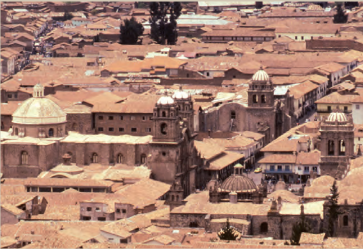
Centro histórico colonial de la ciudad de Cuzco , en Perú.