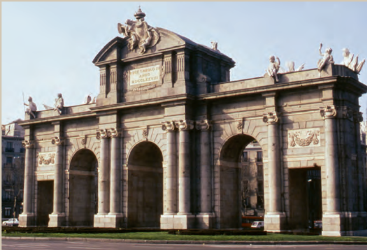
La Puerta de Alcalá , en Madrid, construida por iniciativa de Carlos III y diseñada por el arquitecto italiano Francesco Sabatini (1778)