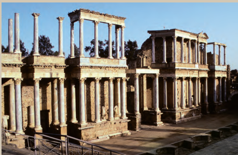
El teatro romano de Emerita Augusta , la actual Mérida, construido en 16-15 a. J.C.