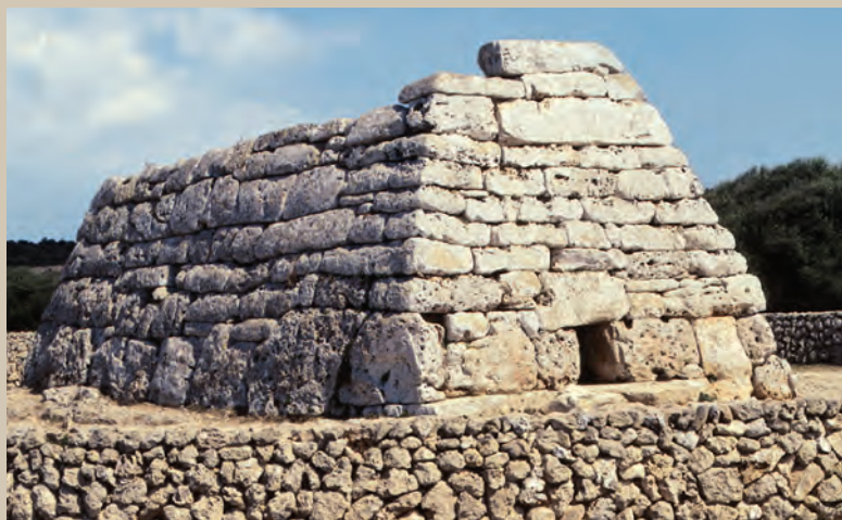
La Naveta des Tudons , ejemplo de la cultura talayótica en Menorca (1000 a. J.C.)

DESDE LOS ORÍGENES DE LA HUMANIDAD HASTA 420 d. J.C.