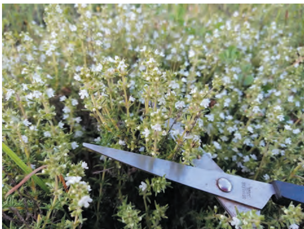
Recolección de sumidades floridas de tomillo salesero ( Thymus zygis ) con tijera para no dañar la planta.

Un programa de radio se titulaba La salud es lo que importa . Y no es un tópico: estar sano es lo mejor para disfrutar lo que se pueda en esta vida. Y ¿qué es la enfermedad? Es un desequilibrio o perturbación del normal funcionamiento de nuestro organismo, una alteración de las funciones vitales normales. En ciertas enfermedades, el organismo tiende a equilibrarse de manera natural y recobrar la salud. Esto ocurre en enfermedades infecciosas, producidas por virus, bacterias, hongos u otros microorganismos o parásitos; o en las accidentales, debido a golpes, roturas o heridas. Es el caso de la soldadura de huesos o la cicatrización de las heridas. El organismo dispone de muy variados mecanismos de defensa. Sin embargo, ciertas enfermedades funcionales tienden a hacerse crónicas, debido al mal funcionamiento de algún órgano o a la falta de secreción de una determinada sustancia vital.