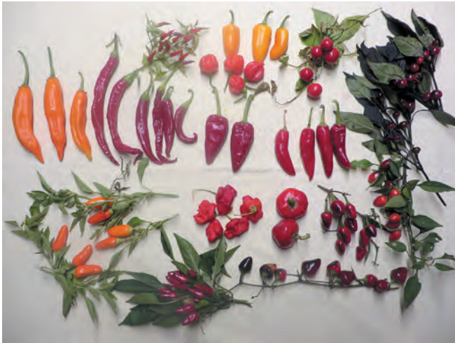
Distintas variedades de guindilla ( Capsicum frutescens )

por ejemplo, la cebolla es un bulbo, un tallo muy comprimido rodeado de hojas engrosadas; el lirio es un rizoma o tallo horizontal subterráneo engordado, mientras que la patata es un tubérculo o tallo engordado.